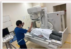
患者さんの気持ちを体験

続いて、栄養科とリハ科へ。リハは新しい試みで、入院患者さんとのリハビリを見学させてもらいました！