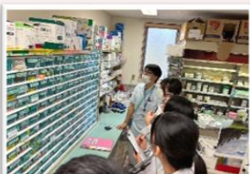
薬剤はいくつあるかな？