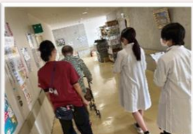
一緒に廊下を一周