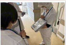
おやつバイキングを紹介

続いて、栄養科とリハ科へ。リハは新しい試みで、入院患者さんとのリハビリを見学させてもらいました！